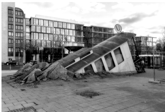
Zugang zum U-Bahnhof Bockenheimer Warte in Frankfurt am Main, gesehen von Uli.

Info: Bernd – Tel. (09 11) 69 66 38 / E-Mail bernd@fes-online.de